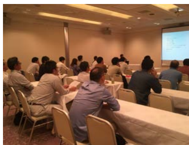
講演風景 (北海道科学大学 今野教授)